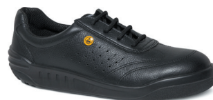
■ 8804 黑色