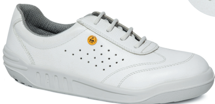
□ 8807 白色 | 码段: 35 -- 47